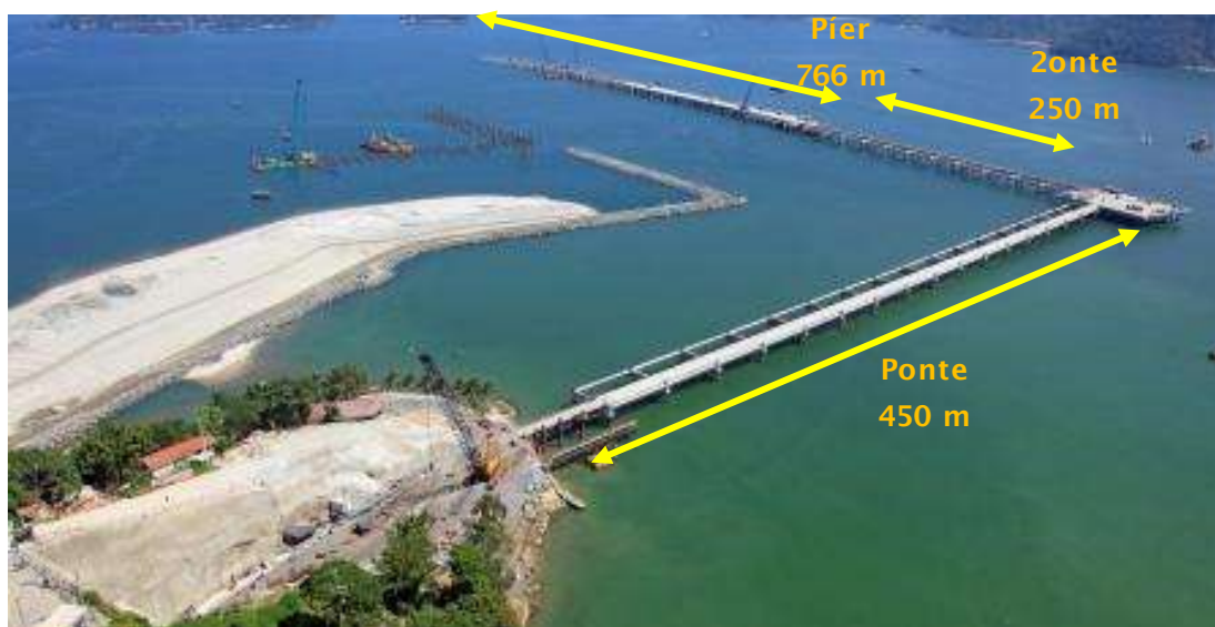
4) Estrutura marítima: Ponte e Píer

4) Estrutura marítima: A Companhia concluiu aproximadamente 75% da dragagem, avançou na infraestrutura da ponte de acesso ao píer e da plataforma que liga as pontes de acesso. Adicionalmente, concluiu 60% da montagem das vigas e blocos do píer. Em fevereiro de 2012, concluiu a cravação da última estaca da estrutura marítima, formada pelas pontes de acesso e o píer. Ao todo foram cravadas 725 estacas.