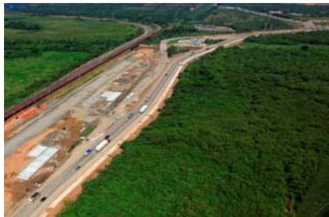
1) Acesso rodoferroviário

rodoferroviário: No final de março, a Companhia finalizou a construção da variante rodoviária sobre o Rio Cação e deu continuidade a construção do viaduto sobre o mesmo rio. A Companhia está em fase de conclusão da construção da infraestrutura de colunas de brita e terraplanagem.