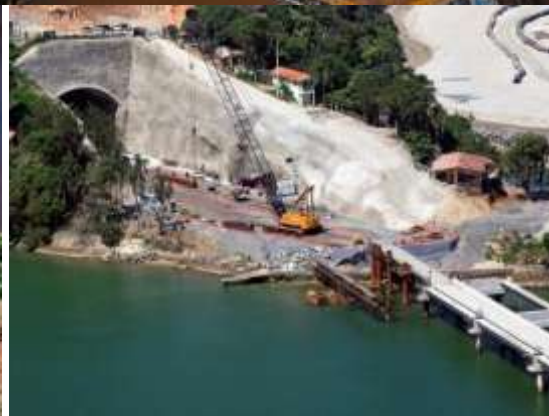
3) Saída do Túnel

4) Estrutura marítima: A Companhia concluiu aproximadamente 75% da dragagem, avançou na infraestrutura da ponte de acesso ao píer e da plataforma que liga as pontes de acesso. Adicionalmente, concluiu 60% da montagem das vigas e blocos do píer. Em fevereiro de 2012, concluiu a cravação da última estaca da estrutura marítima, formada pelas pontes de acesso e o píer. Ao todo foram cravadas 725 estacas.