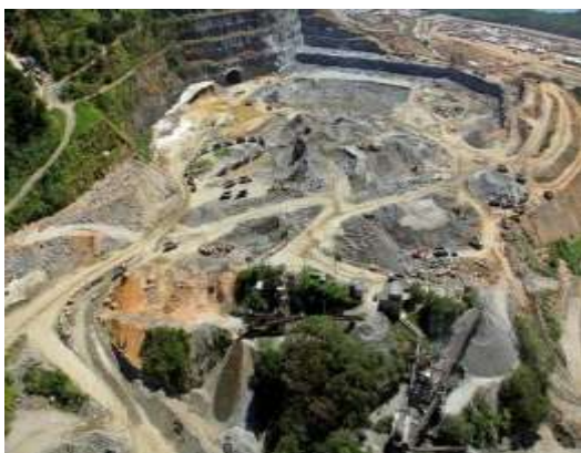
2) Pátio de estocagem 32

2) Pátios de estocagem de elevação 06 e 32 metros: O pátio tem capacidade estática total de 2,5 milhões de toneladas de minério de ferro. Até março de 2012 foram realizados no Pátio 06: continuação da contenção do morro da Mariquita, necessário para instalação da pêra ferroviária; início da montagem dos viradores de vagões; conclusão da infraestrutura e sinalização da estrada que contorna o Pátio 06. Esse trecho rodoviário substituirá a atual estrada Joaquim Fernandes, garantido melhores condições de acesso à comunidade da Ilha da Madeira.