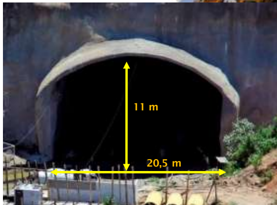
3) Entrada do Túnel