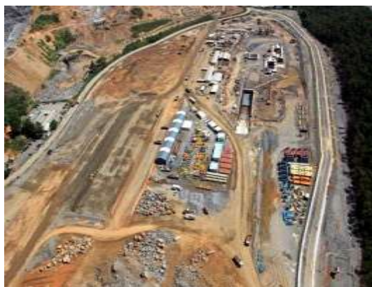
2) Pátio de estocagem 06