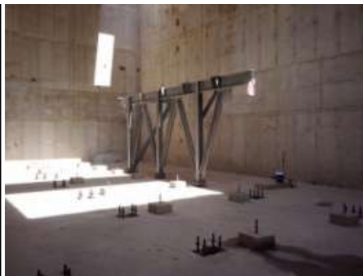
Montagem do virador de vagão

3) Túnel: O túnel que liga os pátios de estocagem à estrutura marítima tem 1,8 quilômetro de extensão, 11 metros de altura e 20,5 metros de largura. Em 2011, a Companhia concluiu a perfuração do túnel. No 1T12, foram concluídos os serviços de rebaixamento do piso, pavimentação do túnel e continuados os trabalhos de contenção das paredes e teto do túnel.