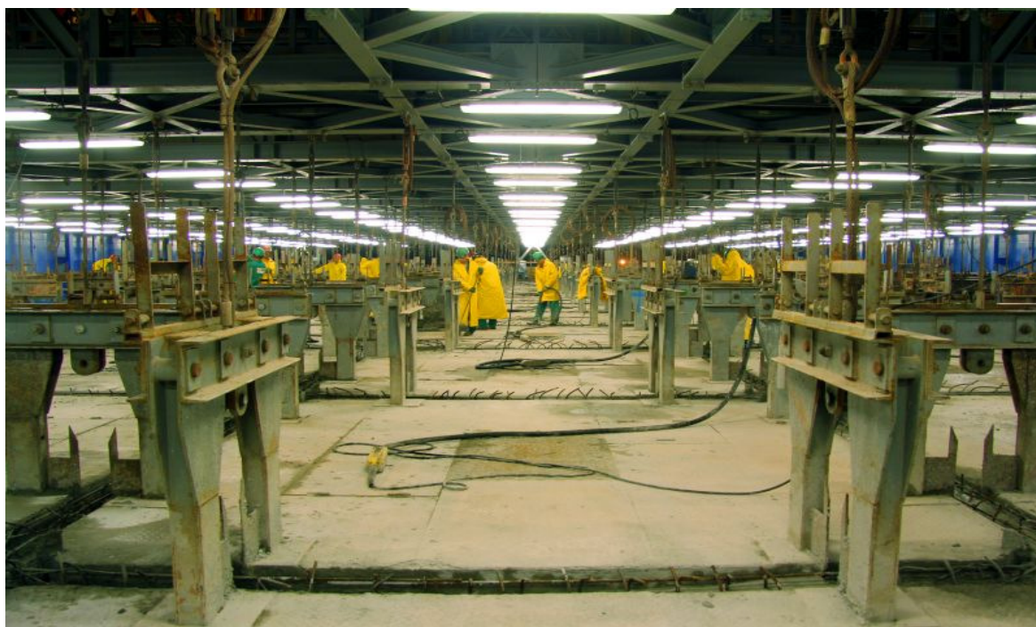
Montagem da armação do 3º dique de concreto em evolução