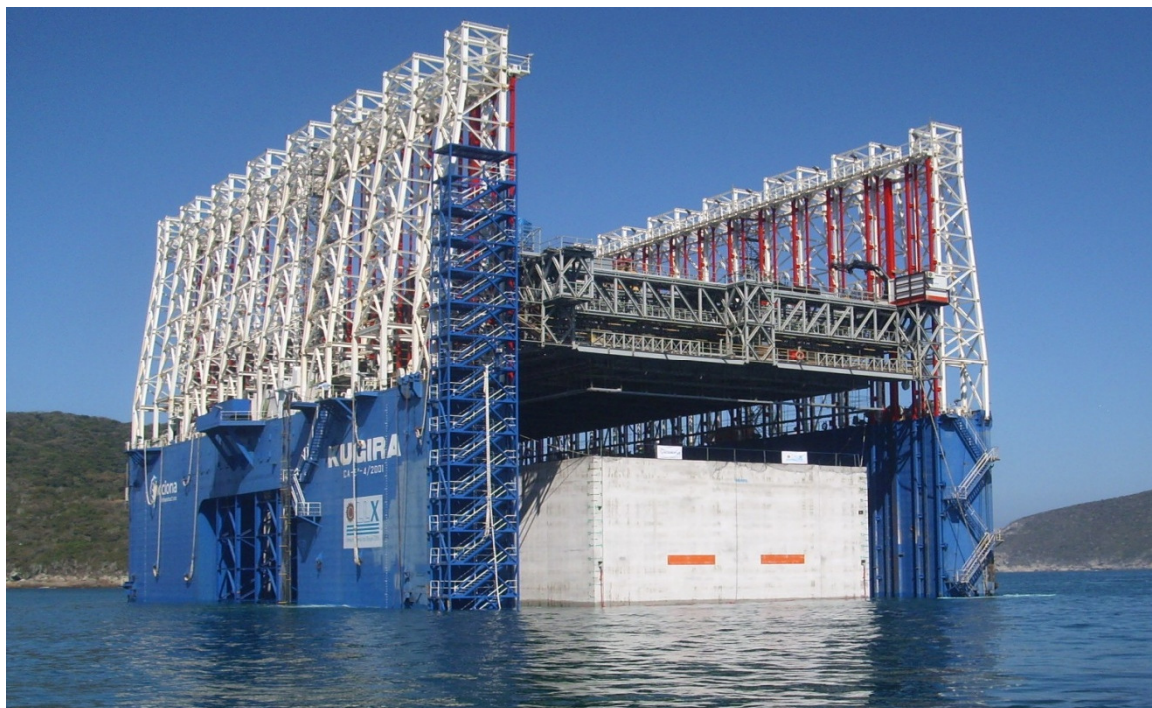
Execução do 1º dique de concreto