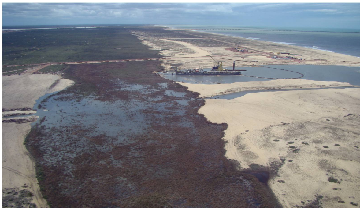
Dragagem em execução no TX2