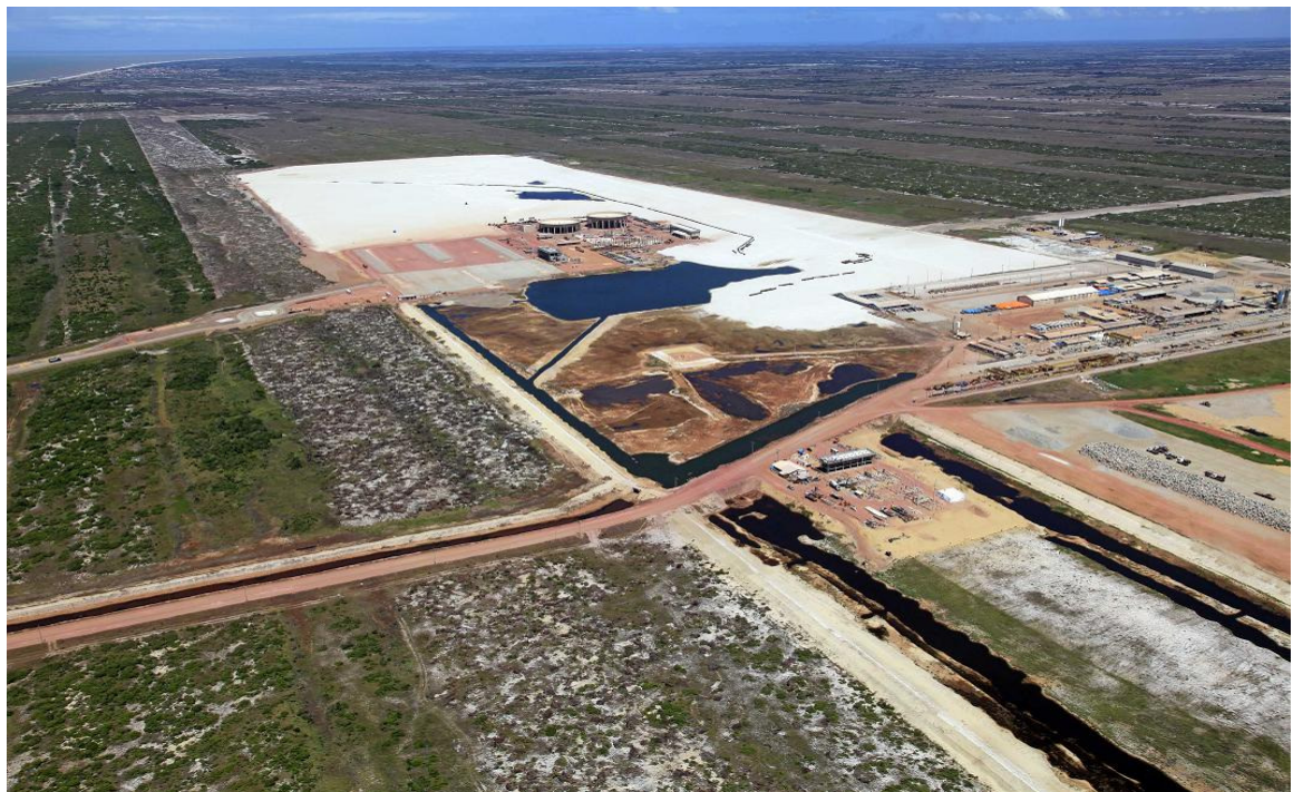
Área de filtragem e estocagem de minério de ferro