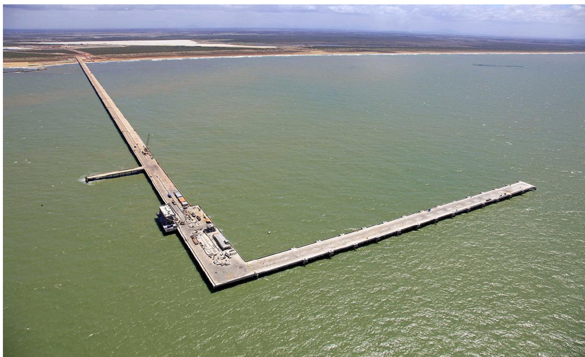
Vista geral da ponte de acesso ao TX1

Mais de 3.200 pessoas, cerca de 50% oriundos das comunidades de São João da Barra e Campos, trabalham atualmente nas obras do Superporto do Açú.