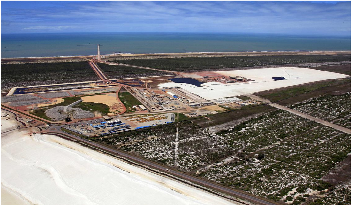
Vista geral da área LLX Minas-Rio no TX1