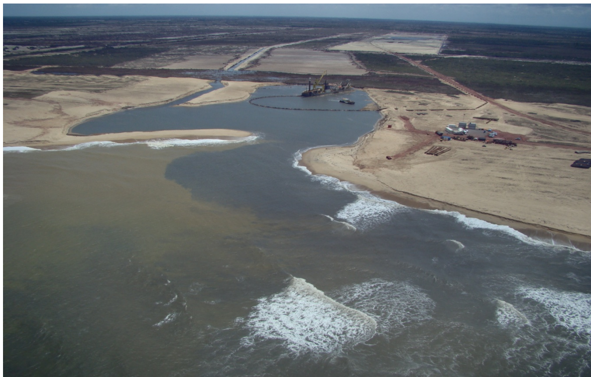
Vista Geral da Dragagem no TX2