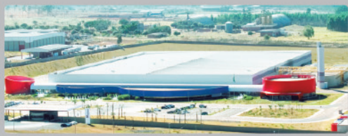
Polo Industrial JK - Brasília - DF