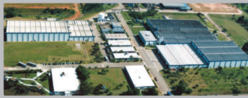
ANOVIS - Taboão da Serra - SP