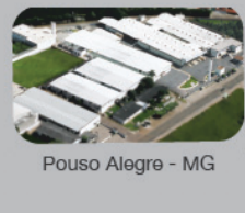
Pouso Alegre - MG