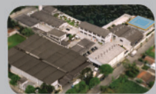
Embu Guaçu - SP