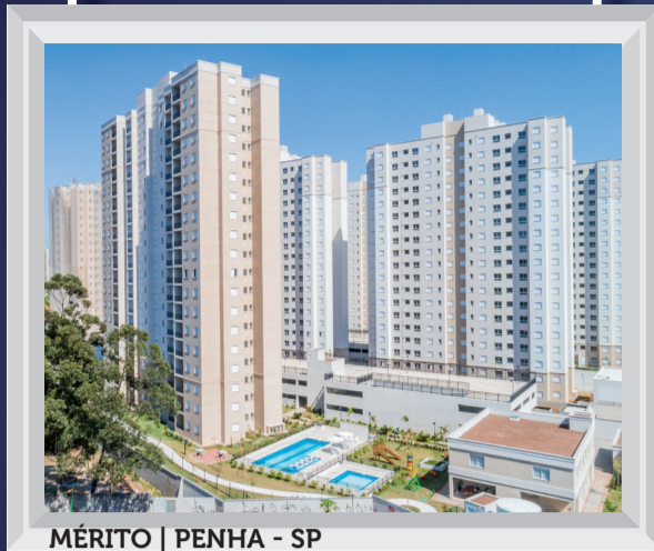
MÉRITO | PENHA - SP