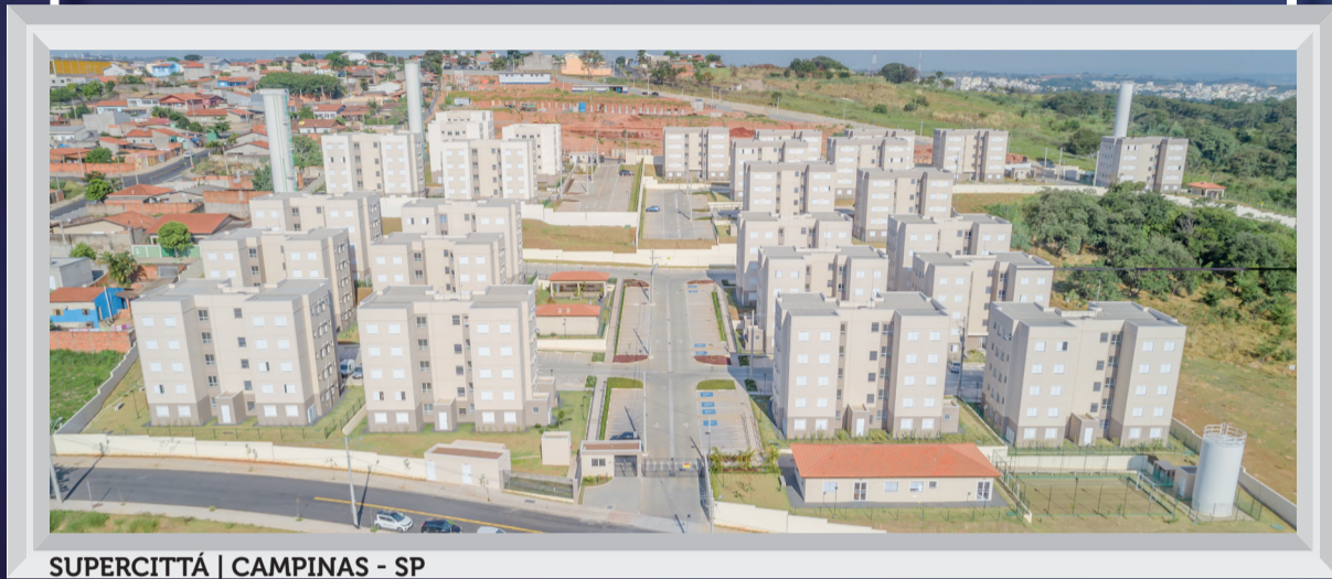
SUPERCITTÁ | CAMPINAS - SP

Em um ano marcado por incertezas macroeconômicas geradas principalmente pelas eleições e pelo ambiente político, a Cury apresentou novamente recordes em seus resultados. Fruto da seleção criteriosa dos terrenos e produtos, e da decisão em manter seus lançamentos nas regiões metropolitanas de São Paulo, Campinas e Rio de Janeiro.