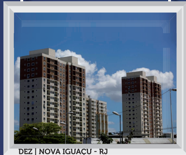
DEZ | NOVA IGUAÇU - RJ