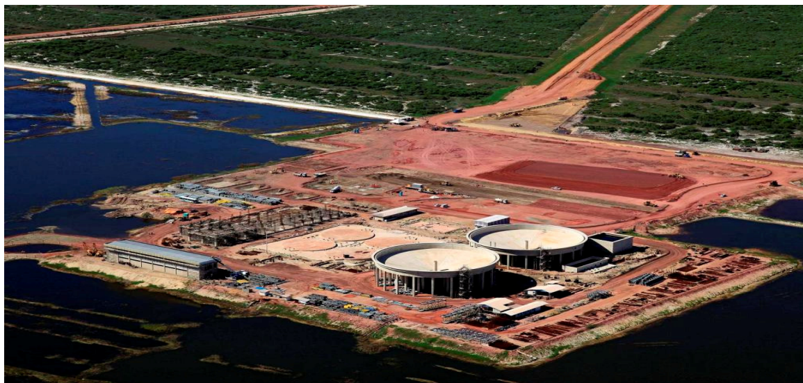
Área de filtragem e estocagem de minério de ferro