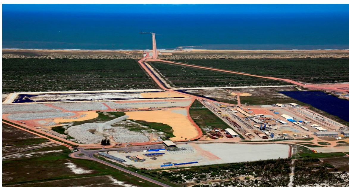
Vista geral da área LLX Minas-Rio no TX1