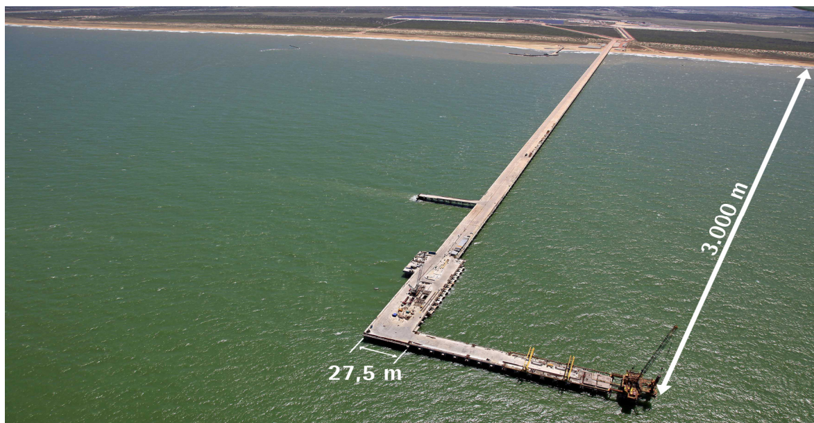
Vista geral ponte de acesso (TX1)

No 4º trimestre de 2010, a LLX Minas-Rio deu continuidade a construção do quebra-mar, que terá 1.300 metros por 925 metros (em forma de “L”) e está sendo construído com pedras oriundas de uma pedreira arrendada nas proximidades do Superporto do Açú. Além de mais de 500.000 m 3 de pedras já produzidas, das quais cerca de 300.000 m 3 estão estocadas no Açú, 21.000 estruturas de concreto denominadas “core-loc”, (das quais mais de 13000 já foram produzidas) comporão as últimas camadas do quebra-mar. Ao final deste trimestre mais de 50% da obra do píer de minério estava concluída e 16 milhões de m 3 de material já havia sido dragado do canal de acesso e bacia de evolução volume equivalente a cerca de 90% do total programado. Mais de 2.000 pessoas, 75% oriundos das comunidades próximas (São João da Barra e Campos), trabalham nas obras do Superporto.