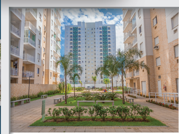
OCEANIC/VERANO | PRAIA GRANDE - SP