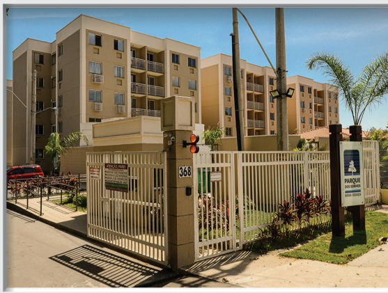
PARQUE DOS SONHOS | NOVA IGUAÇU - RJ