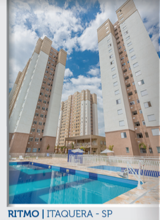
RITMO | ITAQUERA - SP

Em 2017, apesar de mais um ano conturbado politicamente e das incertezas econômicas, a Cury apresenta resultados recordes, construídos com a solidez de suas operações, assertividade nos empreendimentos e cumprimento de prazos, com destaques para vendas, repasses e geração de caixa.