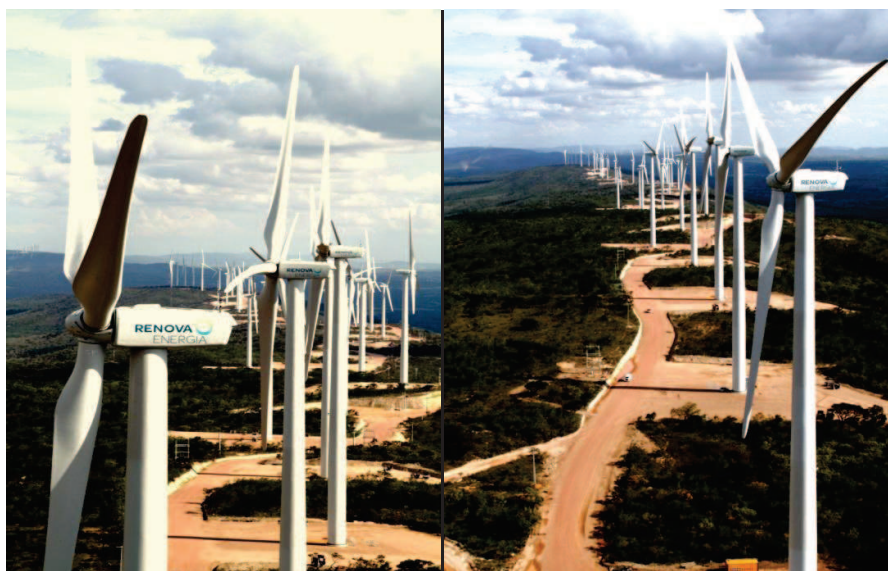
Parques Eólicos Pajeú do Vento e Planaltina

(1) Garantia física estabelecida pelo Ministério de Minas e Energia - MME.