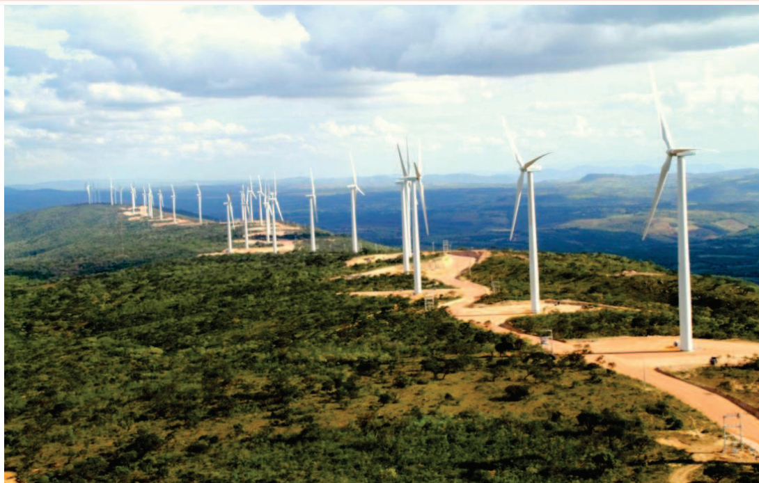
Parques Eólicos Pajeú do Vento e Planaltina