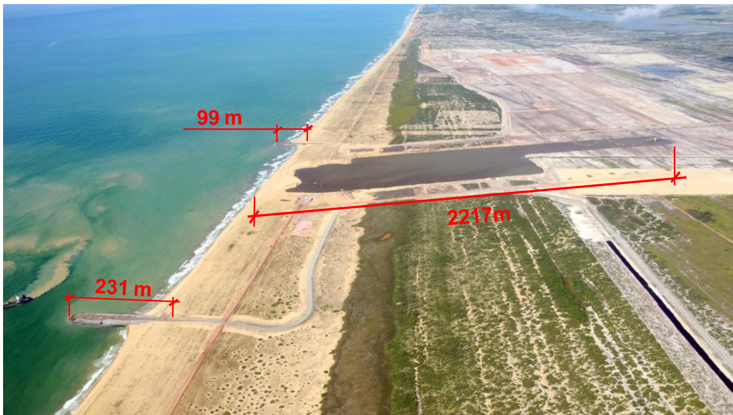
TX2: vista geral da construção do canal onshore TX2