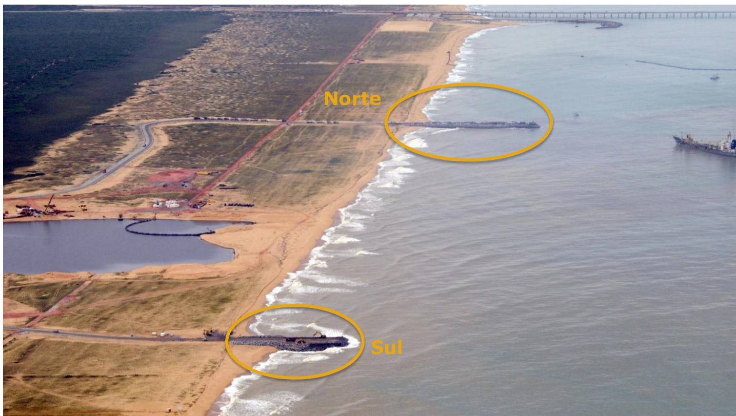
TX2: vista geral da construção do quebra-mar