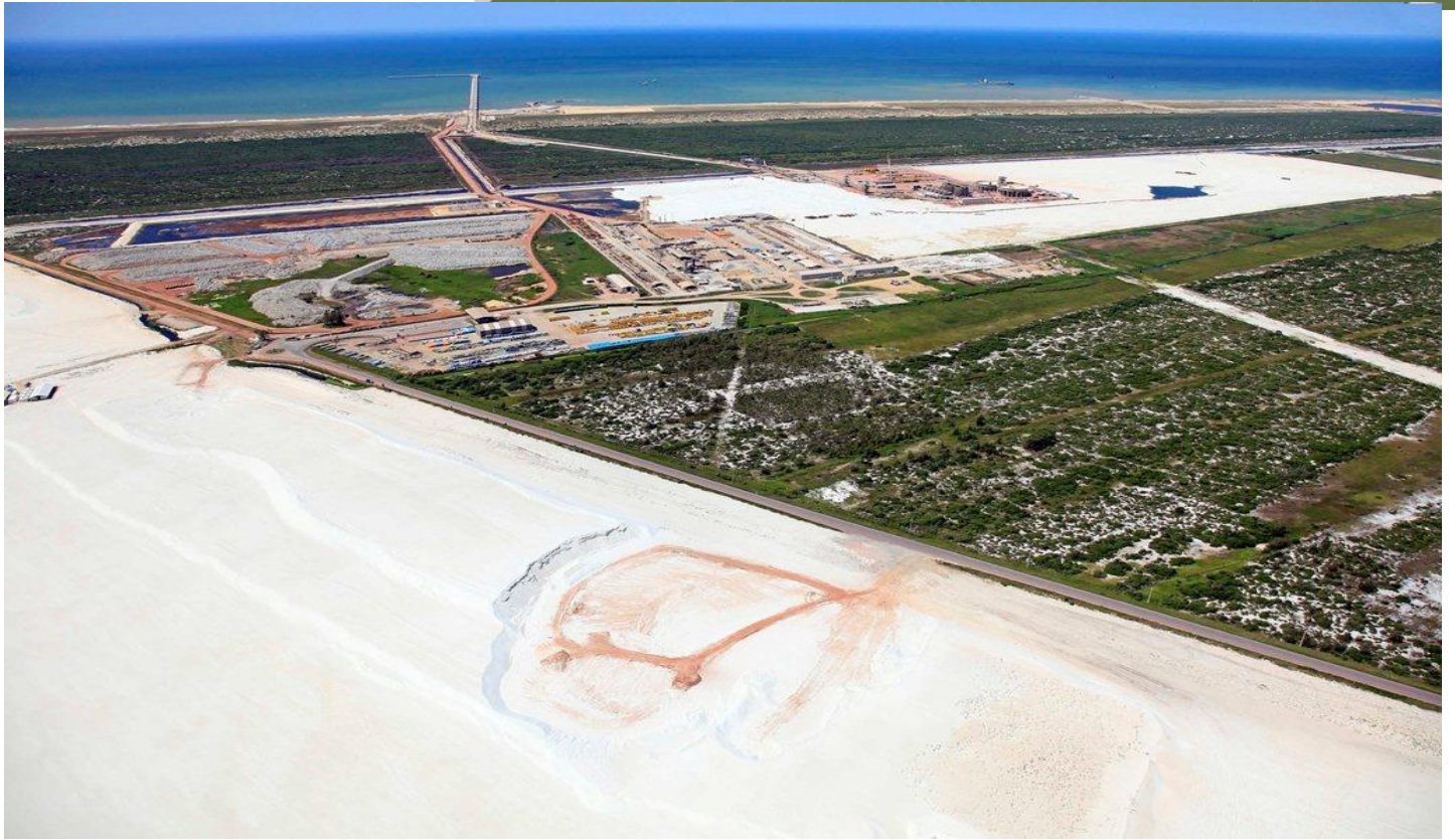
Vista Geral do TX1