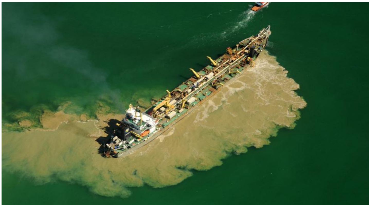
TX2: detalhe da draga Seaway operando