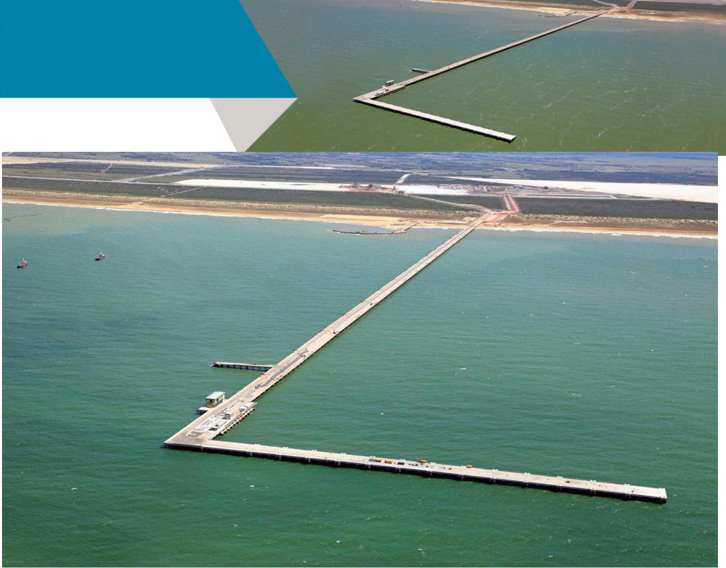
TX1: detalhe píer de minério de ferro