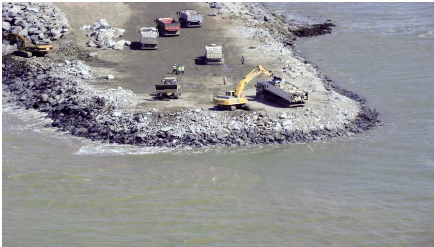
TX2: detalhe das obras no quebra-mar (molhe sul)