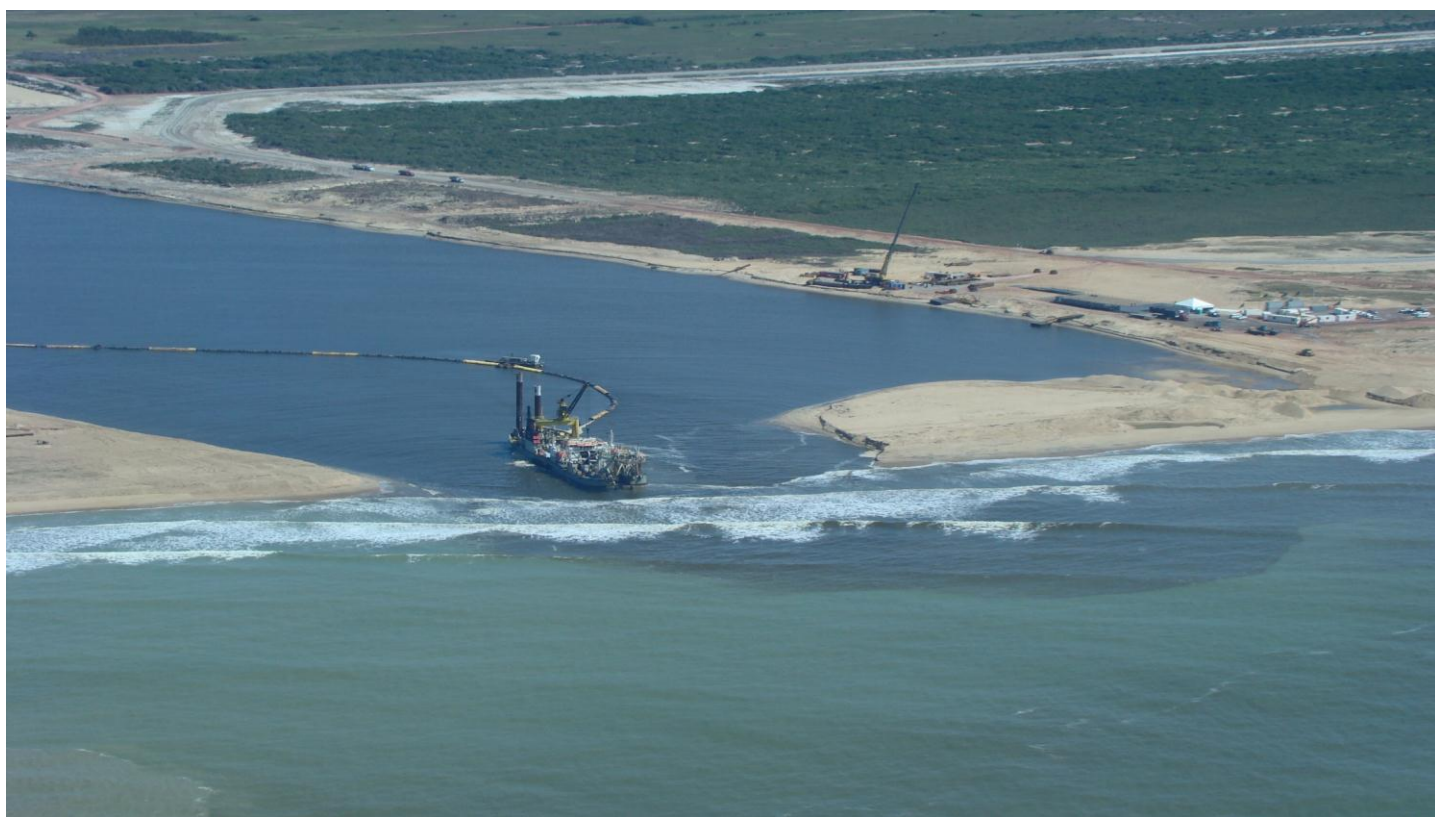
TX2: detalhe da draga Cyrus II operando