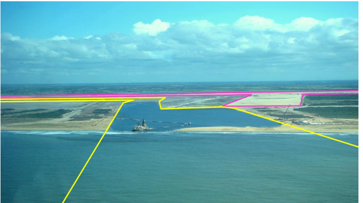
TX2: traçado do canal onshore