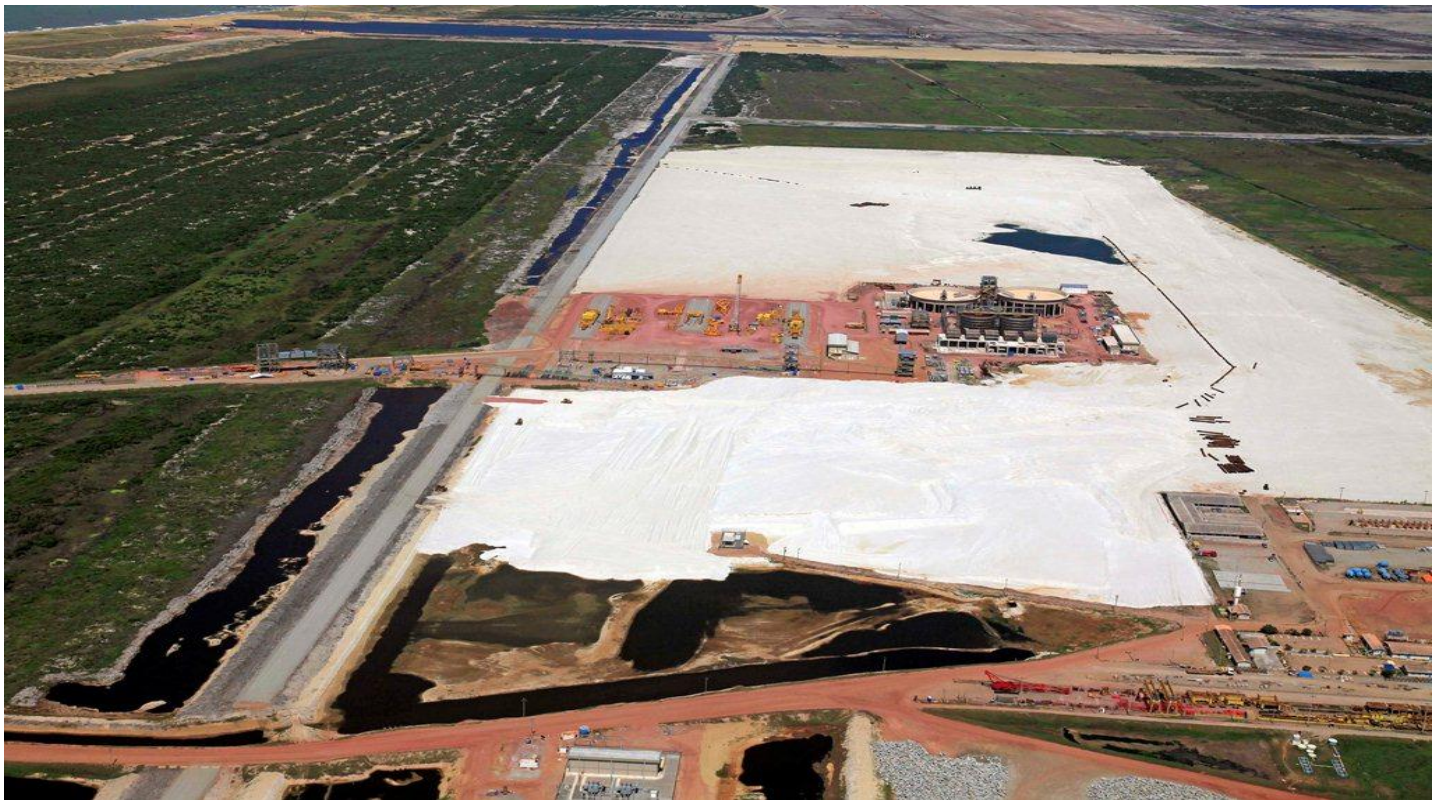
Vista da área da LLX Minas-Rio