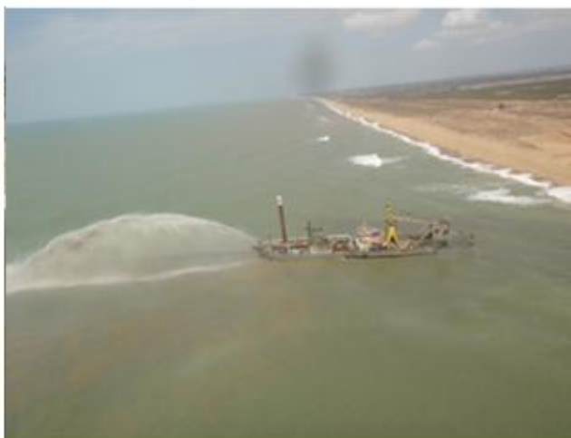
Obras de dragagem