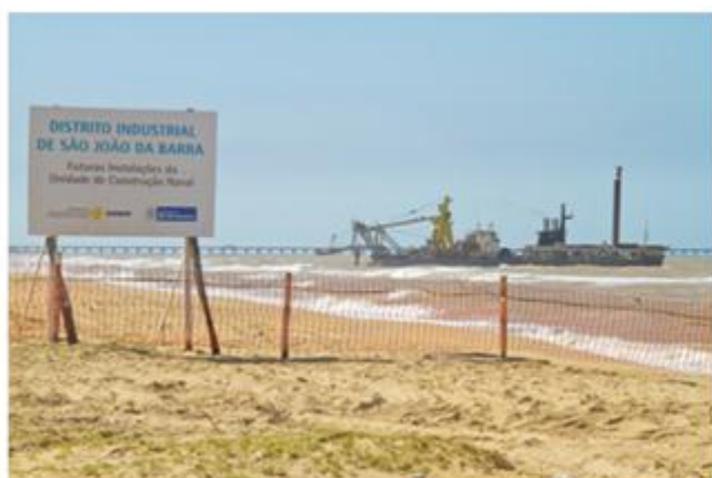
Obras de dragagem