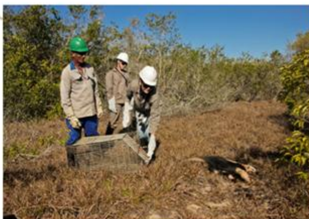
Resgate de Fauna