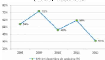
Gráfico 1 - Armazenamento dos reservatórios do SIN em dezembro de cada ano (EAR %)

Com o nível dos reservatórios muito baixo durante o ano de 2012, o Operador Nacional do Sistema (ONS) passou a intensificar a utilização das termelétricas, conforme mostrado no gráfico abaixo: