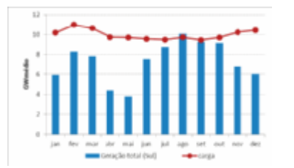
Gráfico 3 - Geração total vs. Carga (Subsistema Sul)

O carregamento excessivo dos troncos de transmissão torna o sistema elétrico mais suscetível a desligamentos em cascata por contingências múltiplas. Isso corrobora a necessidade de geração termelétrica local nos subsistemas, especialmente o subsistema Sul, que é um subsistema importador. Em 2012, o Sul recebeu 2.600 MW médios dos outros subsistemas, este montante de energia corresponde a 26% do seu consumo total. No gráfico a seguir, verifica-se que houve a necessidade de importação de energia no Sul durante praticamente todo o ano de 2012, somente no mês de agosto o Sul foi autossuficiente.