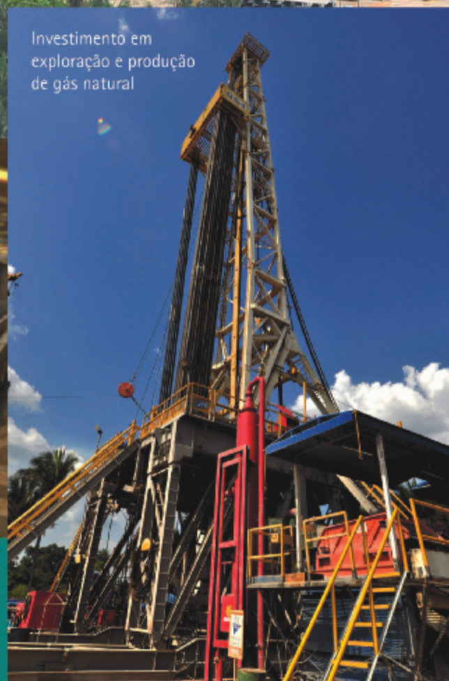
Investimento em exploração e produção de gás natural