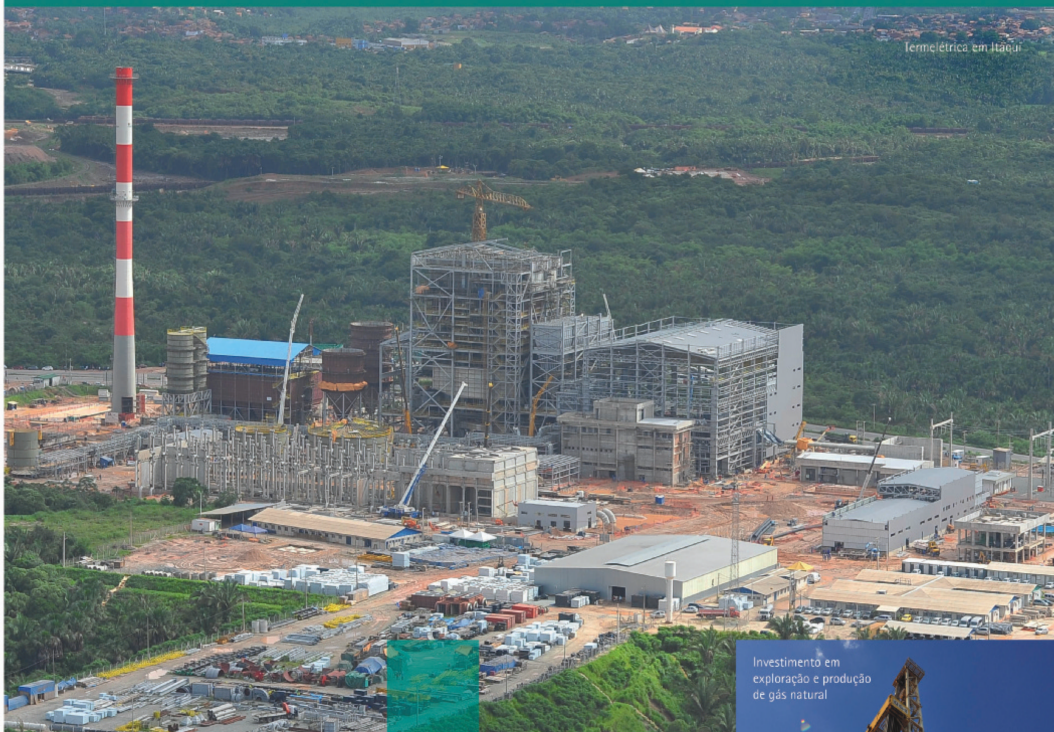
Termelétrica em Itaipu