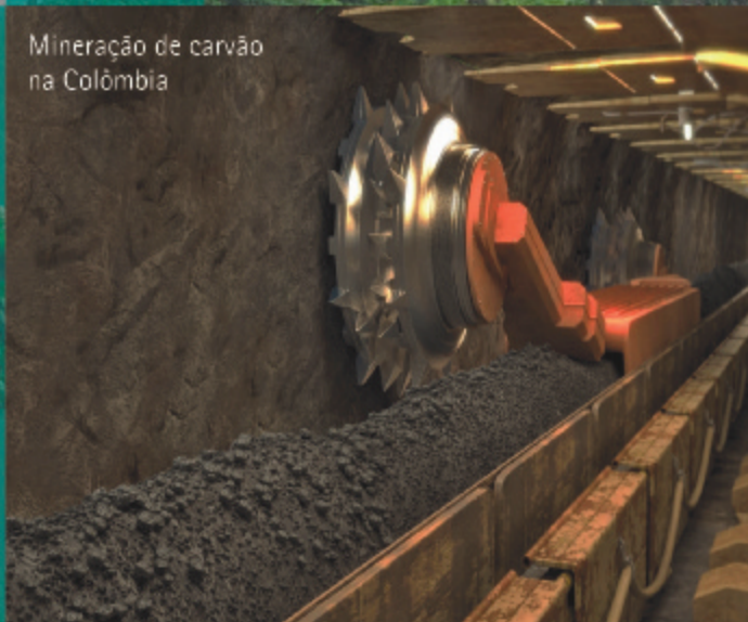
Mineração de carvão na Colômbia