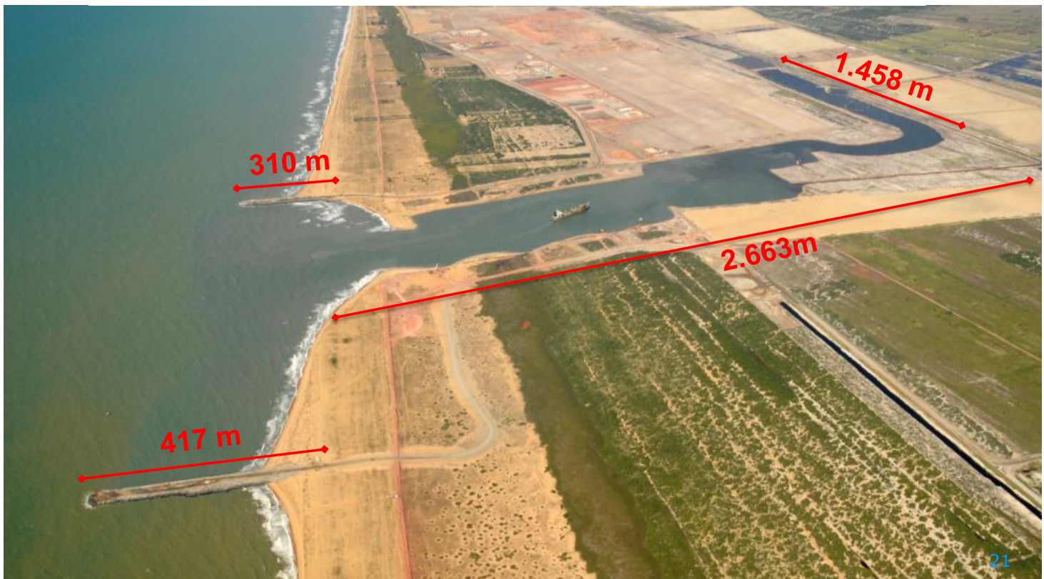
TX2: vista geral da construção do canal onshore