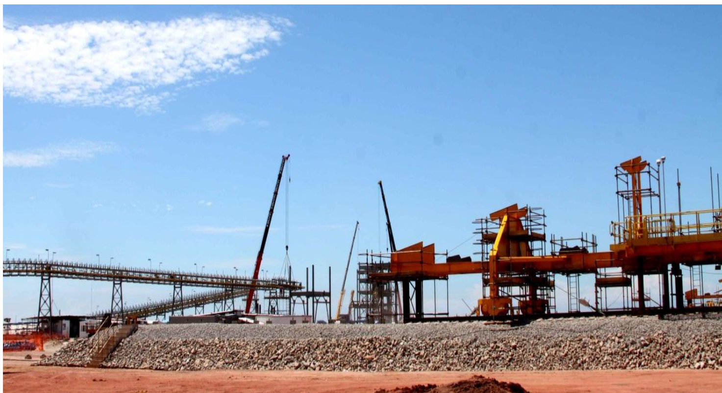
Montagem da Correia Transportadora