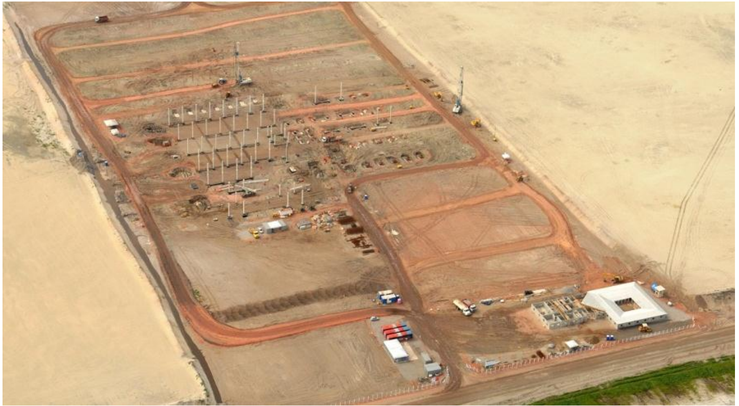
TX2: detalhe do início das obras da NOV