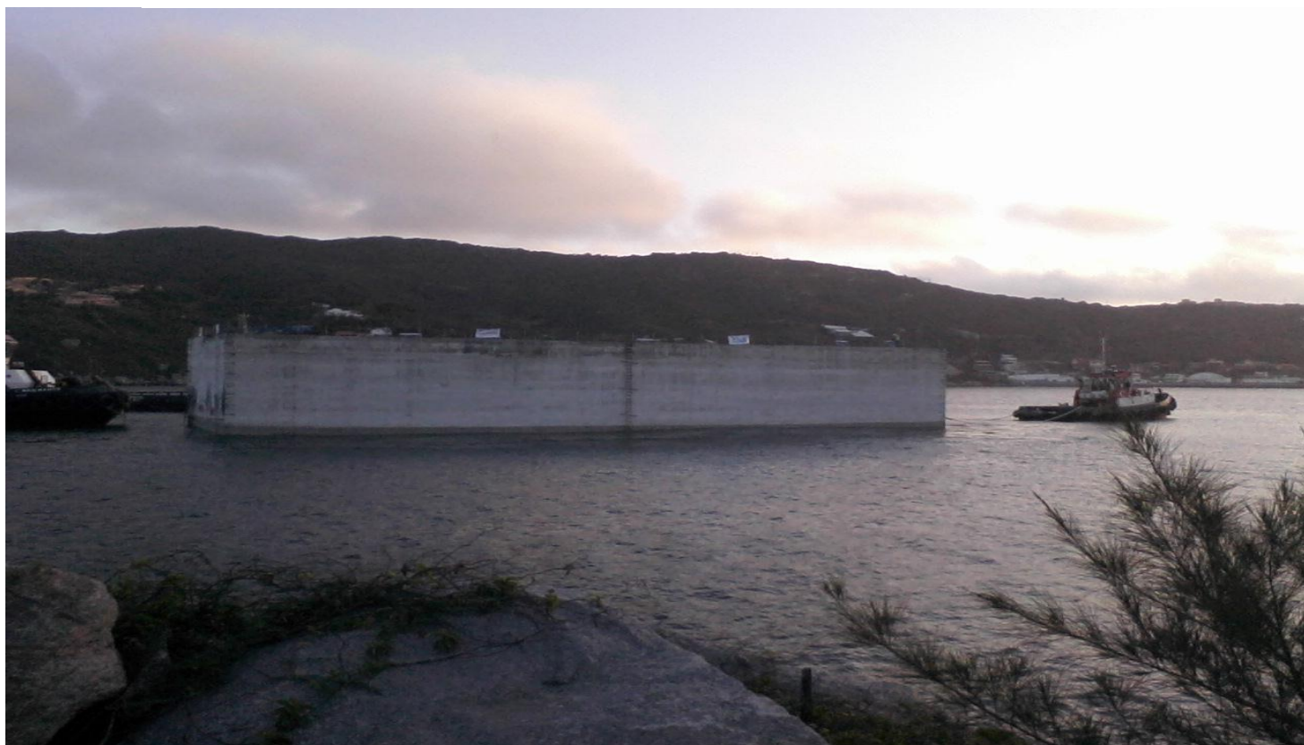
Detalhe do bloco de concreto em Arraial do Cabo