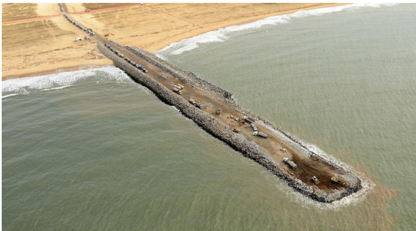
TX2: detalhe das obras no quebra-mar (molhe norte)