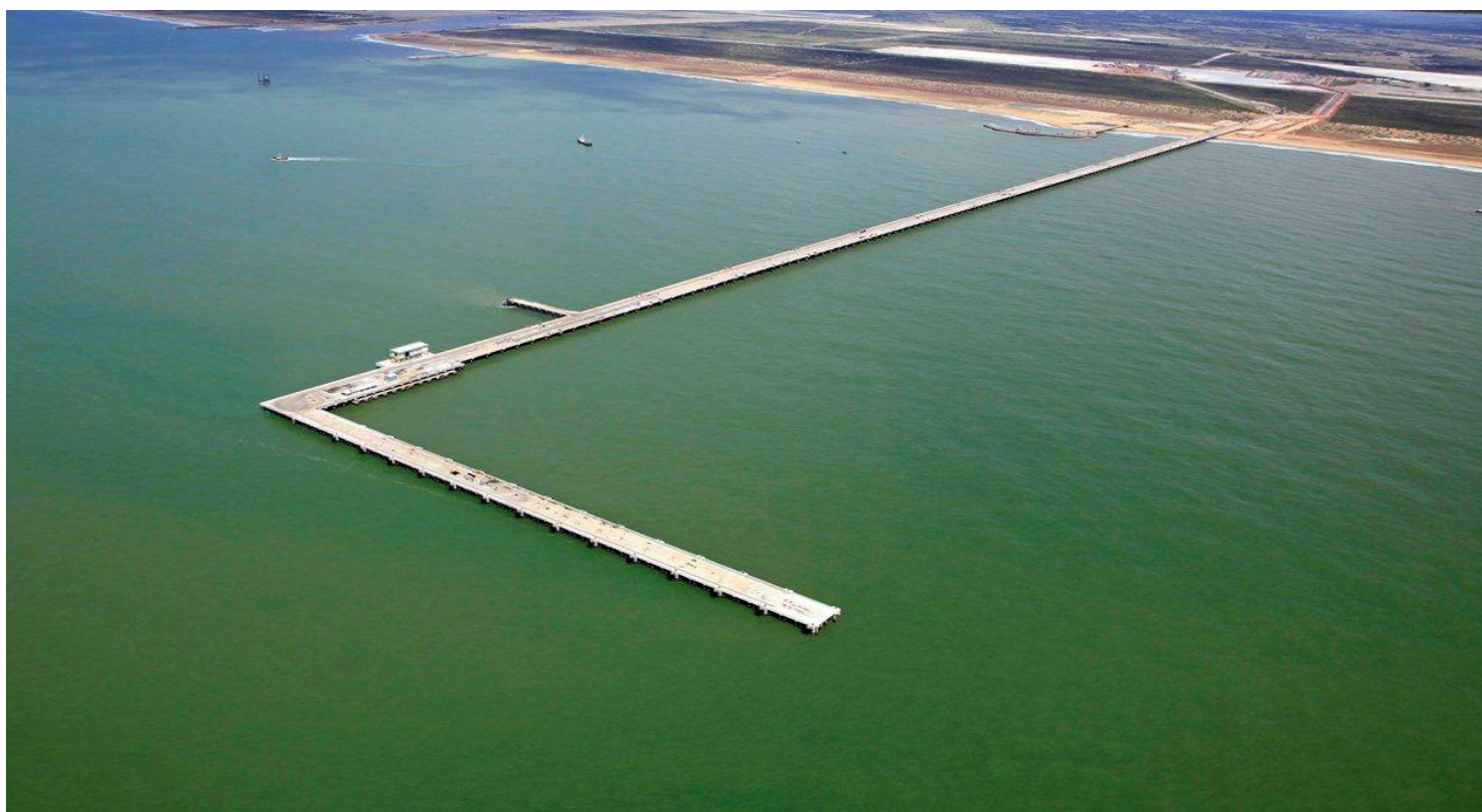
Vista aérea do Píer de Minério de Ferro