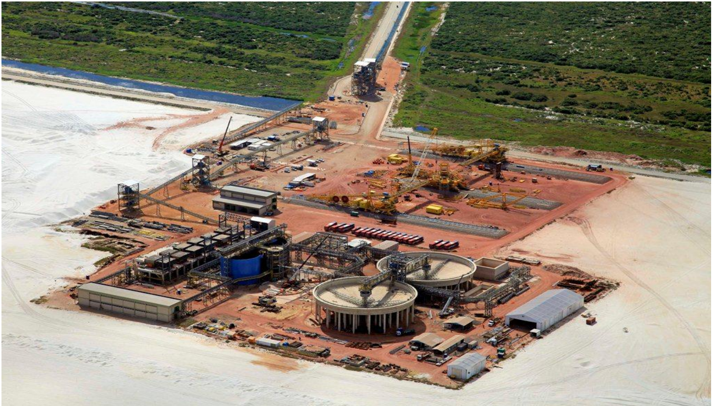
TX1: Vista Geral LLX Minas-Rio