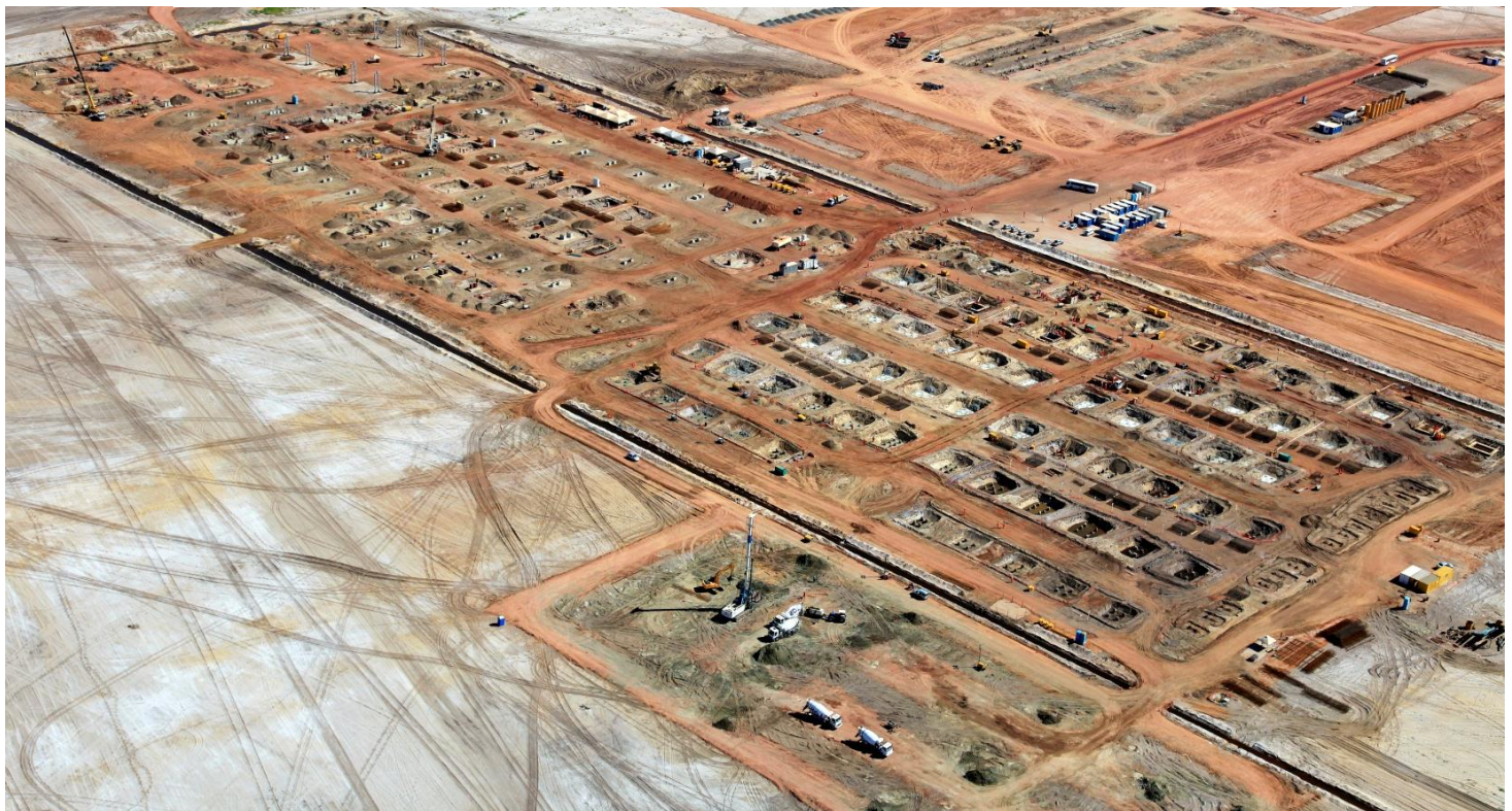
TX2: detalhe das obras Unidade de Construção Naval da OSX