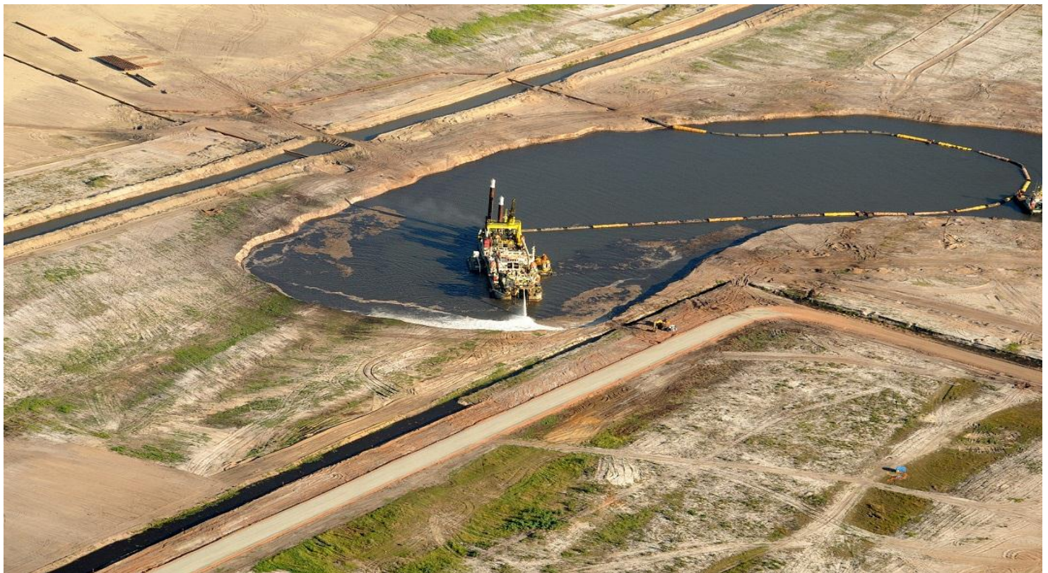
TX2: draga operando