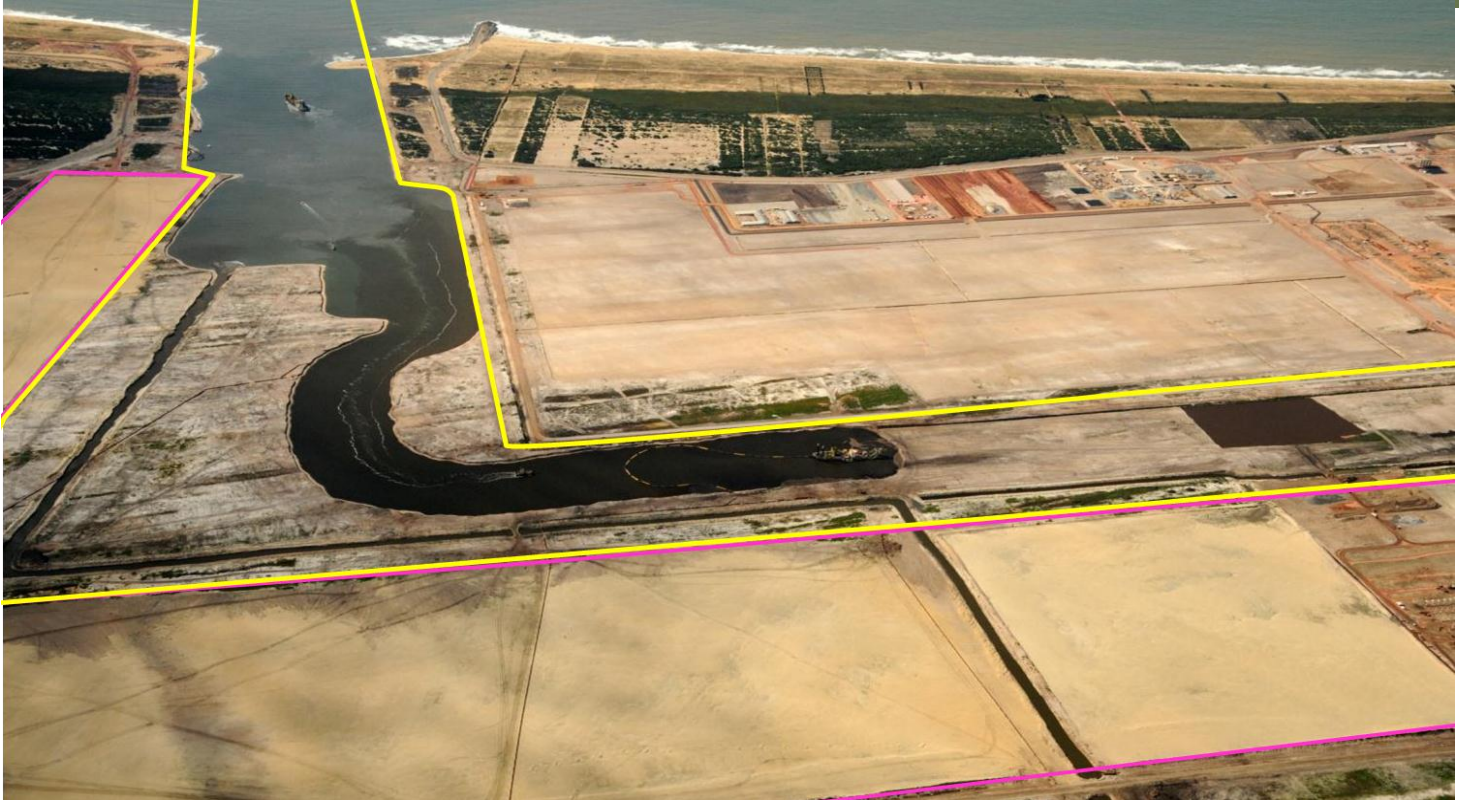
TX2: traçado do canal onshore