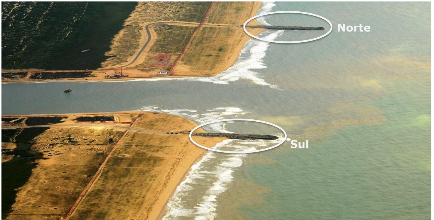
TX2: vista geral da construção do quebra-mar