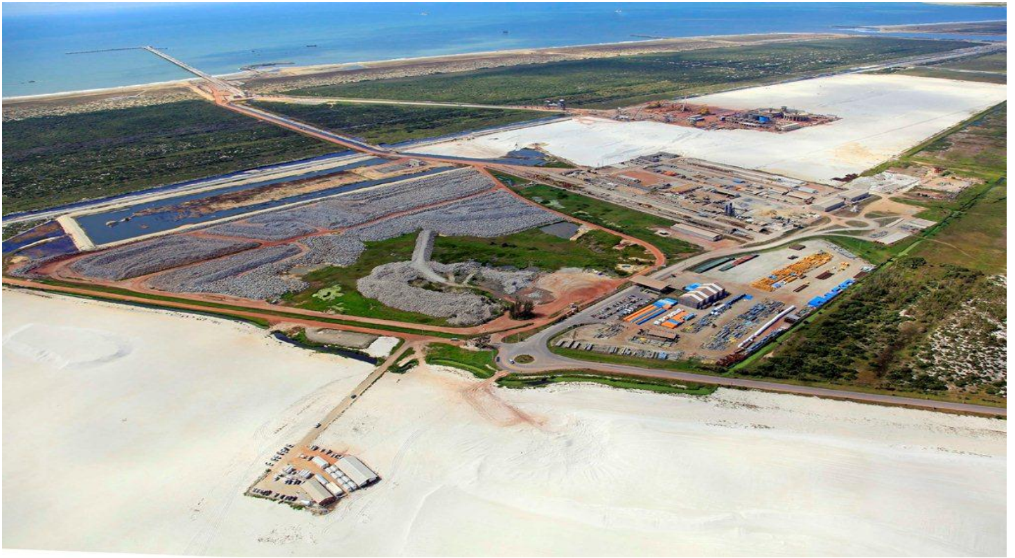
TX1: Vista Geral LLX Minas-Rio e UTP