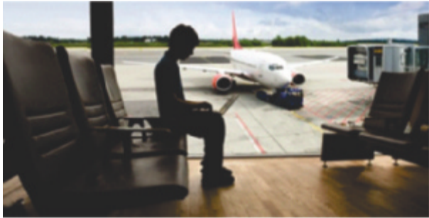
Acesso à internet grátis Wi-Fi

A Infraero, buscando atender o usuário, passou a oferecer sinal gratuito de internet nos aeroportos de Brasília/DF, Guarulhos/SP, Congonhas/SP e Galeão/RJ. Foi estabelecido, em conjunto com as prestadoras do serviço, 15 minutos de acesso livre, por meio de cartão de código de acesso. Em dezembro de 2011 foi publicada a Convocação Pública para ampliação, em 2012, do número de aeroportos e do tempo de conexão, que passará a ser ilimitado.