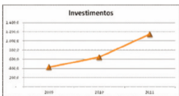
Gráfico evolução dos investimentos