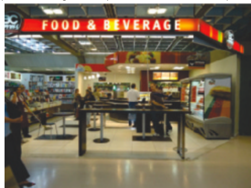
Fast food - Aeroporto Internacional de São Paulo/ Guarulhos - Governador André Franco Montoro

Um varejo aeroportuário bem elaborado, com um mix preparado para atender as expectativas dos usuários, traz a sensação de conforto e aconchego. Essa agradável sensação tem o poder de garantir ao passageiro que sua experiência de viagem começa quando ele chega ao aeroporto, muito antes do embarque no avião.