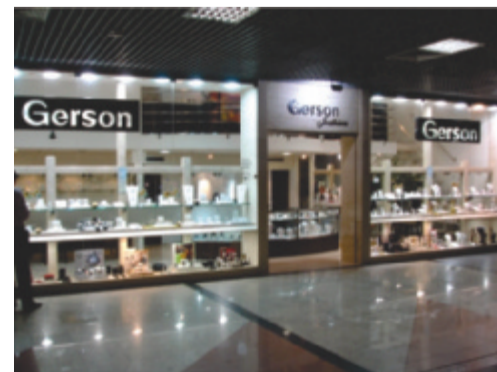
Joalheria - Aeroporto de Internacional de Salvador - Dep. Luis Eduardo Magalhães