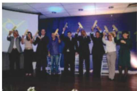
Importadores premiados em evento no Aeroporto Internacional do Rio de Janeiro/Galeão

Em linhas gerais, os principais resultados registrados após a implantação do Programa consistem na redução do tempo de permanência das cargas importadas e, como consequência, a redução com os custos totais de produção dos importadores e, ocasionando, a redução do "custo Brasil", uma vez que os importadores e suas cadeias logísticas passam a aprimorar seus processos em busca do reconhecimento da sociedade.