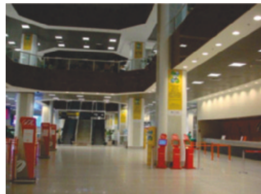
Painéis da campanha Fique por Dentro instalados em área de check-in

Dentro do escopo da campanha Fique por Dentro, vale destacar a ampliação da cobertura da comunicação; o maior envolvimento do público interno; a produção e veiculação de material informativo em vídeo; o Guia do Passageiro também em inglês, entre outras ações.