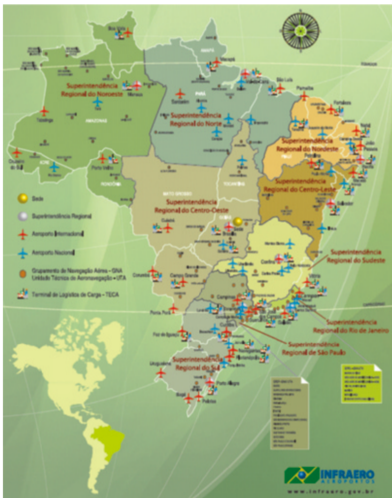
Mapa da Rede Infraero

Presente em todos os Estados da Federação, a Rede Infraero contabilizou, em 2011, cerca de 2,9 milhões de pousos e decolagens de aeronaves nacionais e estrangeiras, transportando 179,9 milhões de passageiros. Em 2011, houve recorde de 1.179,6 mil toneladas processadas nos Terminais de Logística de Carga. O mapa a seguir evidencia os principais pontos de presença da Empresa no território brasileiro.