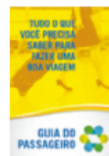
Novo Guia do Passageiro, cujo conteúdo foi atualizado com a participação da Conaero

Novo Guia do Passageiro: Em 2011, o conteúdo da nova versão do Guia do Passageiro foi atualizado com a contribuição de órgãos e empresas públicas que atuam nos aeroportos – como Receita Federal, Polícia Federal, Anvisa, Anac, entre outras -, coordenadas pela Conaero e sob a supervisão da SAC. Foi a primeira vez que o setor produziu um material dedicado aos usuários dos aeroportos, sobre seus direitos e deveres, de forma coordenada.