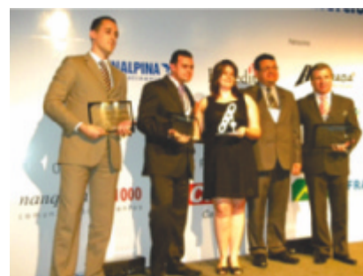
Importadores premiados em evento no Aeroporto Internacional de Viracopos/Campinas