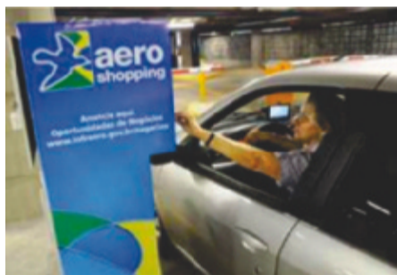
Divulgação da marca Aeroshopping nos estacionamentos

Sempre visando à atividade comercial e buscando auferir receita, o espaço publicitário a ser explorado nos tetos de entrada e saída dos estacionamentos dos aeroportos será divulgado mediante adesivagem com a marca Aeroshopping .