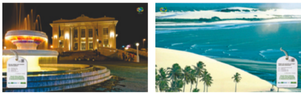
Peças da Campanha