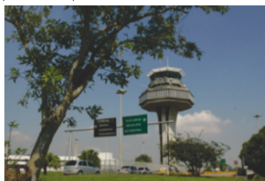
Torre de controle do Aeroporto Internacional do Rio de Janeiro/Galeão – Antonio Carlos Jobim (RJ)

para quem trabalha ou reside próximo aos aeroportos.