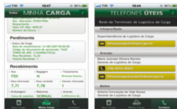
Tela do aplicativo mobile criado para otimizar o acompanhamento de cargas importadas e exportadas movimentadas pela Rede Teca

O aplicativo traz também o Guia Infraero Carga, com as etapas do processamento da carga na Rede e várias informações importantes sobre soluções logísticas da Infraero para o comércio exterior. Permite ainda consultar o status das cargas por meio do conhecimento aéreo (AWB e HAWB) e a criação de uma lista de favoritos para facilitar o acesso às informações e alterar dados cadastrais.