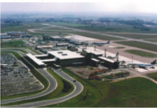
Aeroporto Internacional de Curitiba – Afonso Pena (PR)

A integração entre planejamento e tecnologia fez de 2011 um ano de estudos, adequações e reformulação de procedimentos. As medidas visam à operação com aeronaves maiores e mais eficiência logística e incluem, por exemplo, a expansão do Sistema de Monitoração Veicular (Simove), que já havia sido instalado no Aeroporto Internacional de Brasília – Presidente Juscelino Kubitschek (DF) e foi expandido para dois outros aeroportos: Aeroporto Internacional de São Paulo/Guarulhos – Governador André Franco Montoro (SP) e Aeroporto Internacional do Rio de Janeiro/Galeão – Antonio Carlos Jobim (RJ).