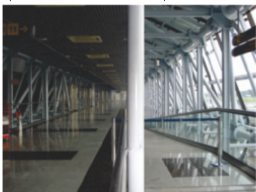
Obra concluída do conector interno do Aeroporto Internacional do Recife/Gilberto Freyre - Guararapes (PE)

A agilidade na contratação das empresas para a realização de obras foi impulsionada pela criação do Regime Diferenciado de Contratações (RDC), respaldado pelo Decreto nº 7.581/2011. O RDC garante nova dinâmica para as licitações, sem descuidar das observações legais necessárias às contratações feitas pelas empresas públicas. De acordo com o Decreto, o RDC deve ser aplicado, exclusivamente, às licitações e contratos necessários para a realização da Copa das Confederações em 2013, da Copa do Mundo em 2014, dos Jogos Olímpicos e Paraolímpicos em 2016, bem como para as obras de infraestrutura e contratação de serviços para os aeroportos das capitais dos estados distantes até 350 quilômetros das cidades sedes das competições.