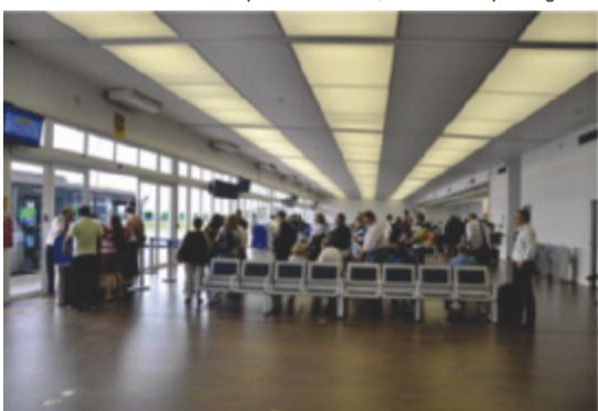
Nova sala de embarque do Aeroporto Internacional de Brasília – Presidente Juscelino Kubitschek

Um segundo terminal modular será instalado no Aeroporto Internacional de Brasília – Presidente Juscelino Kubitschek (DF) e aumentará a capacidade de embarque em um milhão de passageiros por ano. O Aeroporto Internacional de Porto Alegre – Salgado Filho (RS) também passará por reformas e aumentará a capacidade em 1,2 milhão de passageiros no embarque e no check-in .