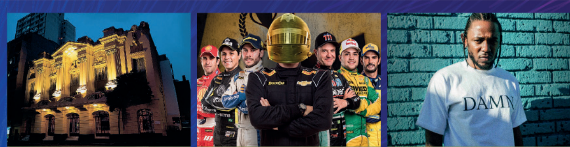
TEATRO RENAULT STOCK CAR KENDRICK LAMAR