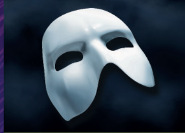
O FANTASMA DA ÓPERA