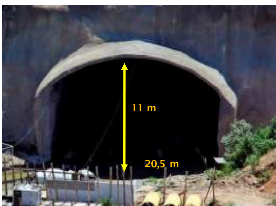
3) Entrada do Túnel

3) Túnel: O túnel que liga os pátios de estocagem à estrutura marítima tem 1,8 quilômetro de extensão, 11 metros de altura e 20,5 metros de largura. No 3T11, a companhia concluiu a perfuração do túnel, que já contempla a expansão da capacidade do Superporto Sudeste para 100 milhões de toneladas. No 4T11, foram concluídos os serviços de rebaixamento do piso, iniciada a pavimentação do túnel e continuados os trabalhos de contenção das paredes e teto do túnel.