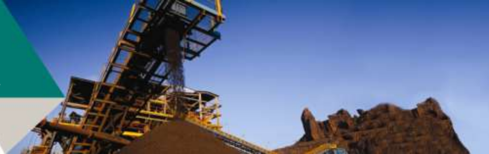
Perfil da dívida