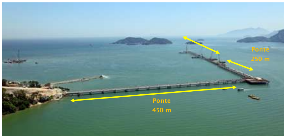
4) Estrutura offshore: Ponte e Pier

fevereiro de 2012, a companhia concluiu a cravação da última estaca da infraestrutura, formada pelas pontes de acesso e o píer. Ao todo foram cravadas 725 estacas.