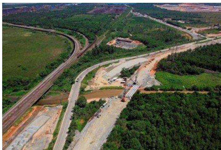
1) Acesso rodoferroviário

1) Acesso rodoferroviário: No final do ano passado, a companhia construiu 70% da variante rodoviária sobre o Rio Cação e deu início a construção do viaduto sobre o mesmo rio, que terá 20 metros de largura e 600 metros de extensão. Com relação ao acesso rodoferroviário a companhia registrou significativo avanço na infraestrutura de colunas de brita e terraplanagem.