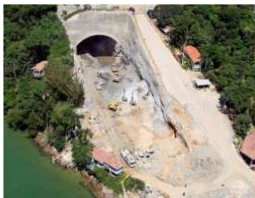
3) Saída do Túnel

4) Estrutura marítima: A companhia concluiu 60% da dragagem, avançou na infraestrutura da ponte de acesso ao píer, que possui o comprimento total de 700 metros e na plataforma que liga as pontes de acesso. A companhia também realizou 90% da cravação das estacas do píer, que possui o comprimento de aproximadamente 766 metros. Em