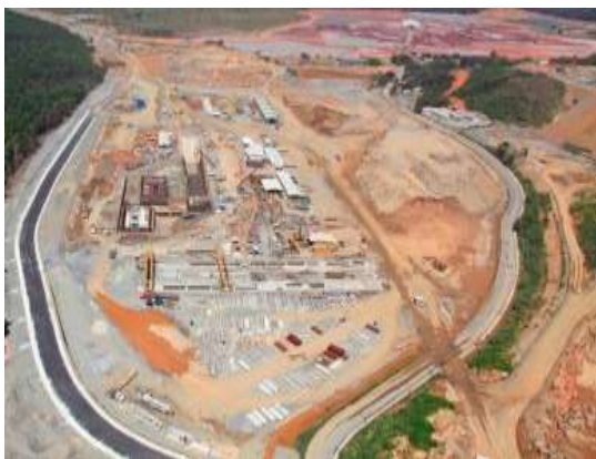
2) Pátio de estocagem 06

progresso nas obras de sinalização e iluminação da estrada que contorna o Pátio 06. Esse trecho rodoviário, que no futuro, substituirá a atual estrada Joaquim Fernandes, garantido melhores condições de acesso à comunidade da Ilha da Madeira.