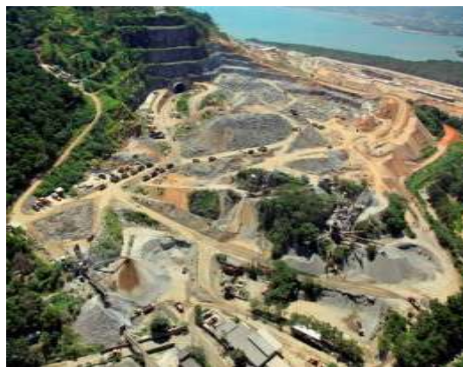
2) Pátio de estocagem 32

3) Túnel: O túnel que liga os pátios de estocagem à estrutura marítima tem 1,8 quilômetro de extensão, 11 metros de altura e 20,5 metros de largura. No 3T11, a companhia concluiu a perfuração do túnel, que já contempla a expansão da capacidade do Superporto Sudeste para 100 milhões de toneladas. No 4T11, foram concluídos os serviços de rebaixamento do piso, iniciada a pavimentação do túnel e continuados os trabalhos de contenção das paredes e teto do túnel.