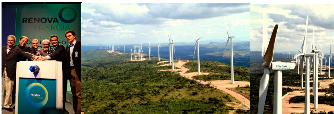
Inauguração do Complexo Eólico LER 2009 – Alto Sertão I.

Todos os parques eólicos já possuem as licenças ambientais de operação, emitidas entre os dias 02 e 15 de junho de 2012 pelo Instituto de Meio Ambiente do Estado da Bahia – IMA.