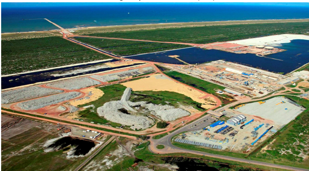
Vista geral da área LLX Minas-Rio no TX1