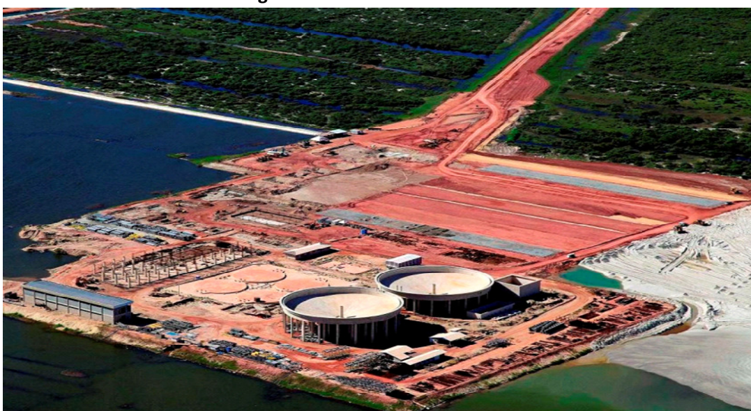
Área de filtragem e estocagem de minério de ferro