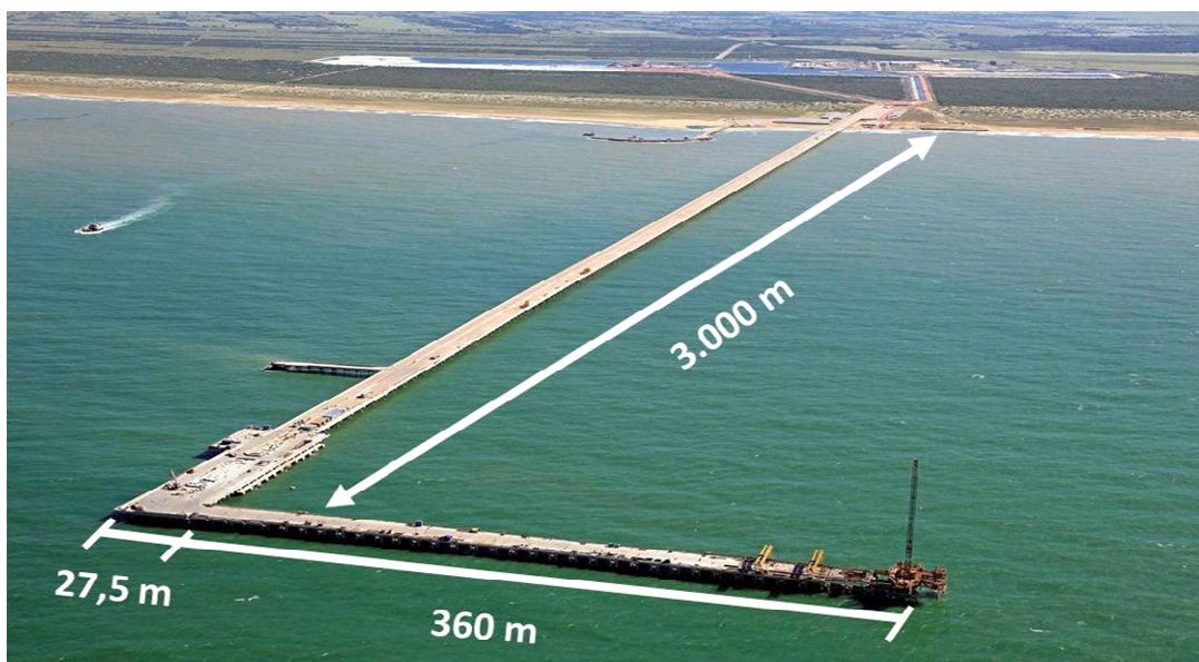
Vista geral ponte de acesso (TX1)