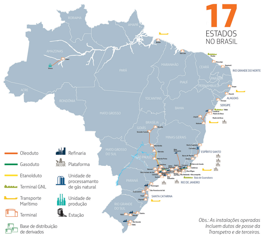
Obs.: As instalações operadas incluem dutos de posse da Transpetro e de terceiros.

Além da atuação em todo o Brasil, por meio de dutos, terminais e navios, a Transpetro atua no exterior, em operações de longo curso dos navios da frota.