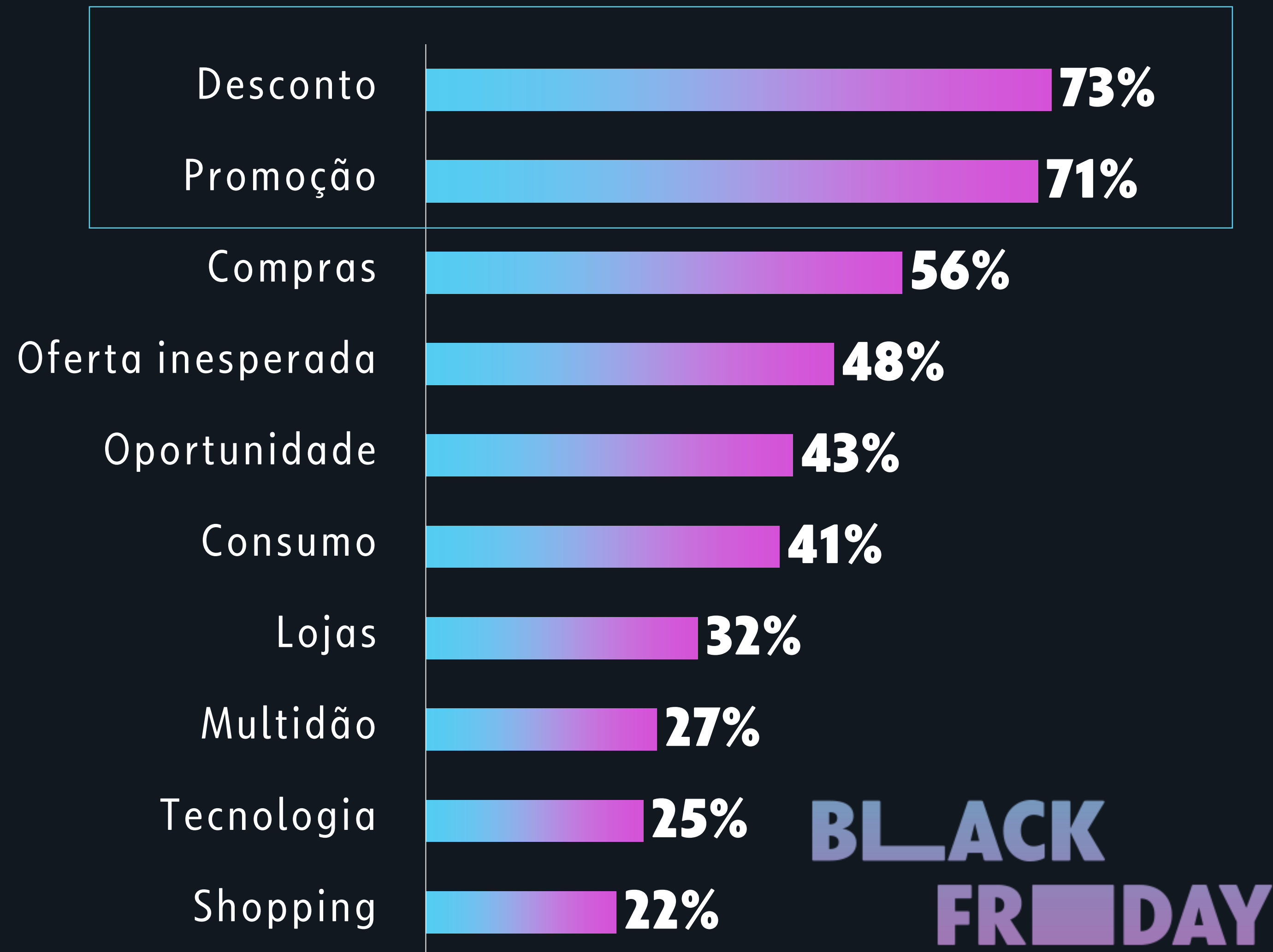
QUAL O SIGNIFICADO DA BF? (%)