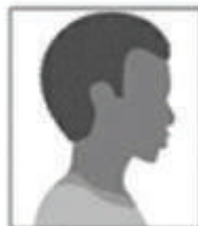
Figura 2. Modelo de Foto de Perfil

III- um vídeo individual recente (com, no máximo, 30MB e de até 30 segundos de tempo de duração), contendo resumidamente sua autodeclaração, a qual o candidato deverá iniciar dizendo: