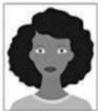
Figura 1. Modelo de Foto Frontal